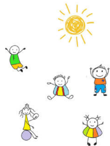
OPSTAPIJE ELTERN-KIND-GRUPPE (E:DU)

Beim gemeinsamen Spielen werden Sie Freude am Spielen und Lernen entdecken. E-du informiert Sie zusätzlich über alle Fragen um die frühkindliche Entwicklung und über Angebote für Familien im Bezirk.